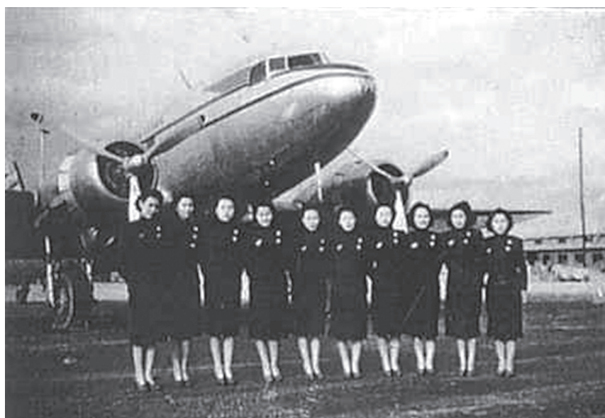
◆ 中航客機途經夏威夷時，中國空姐合影。