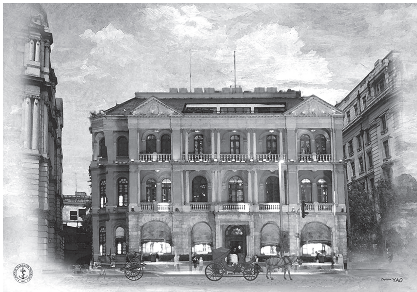
◆外灘輪船招商總局。