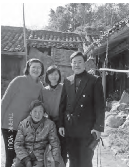
◆作者（後中）和兄姊回舟山探母。