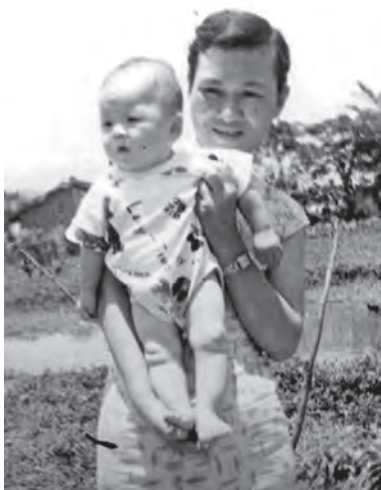
◆來到台灣的美麗姆媽。

成長過程中，常聽姆媽說到舟山老家有允文允武的外公，惜英年早逝，多年後被追封為抗日英雄。外婆生了六個女兒，個性嫻靜善良，不與人爭，是位仁慈