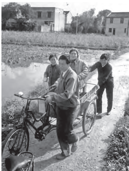
◆姆媽（坐在車上）回鄉定居生活照。

1994年底，當我接到姆媽病危住院的消息，緊急向服務的學校請了假，火速飛到她身旁，她又奇蹟式好轉。第一次到舟山，長途跋涉，轉機，搭船，好多親