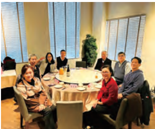
陳理事長邀宴本會理監事及貴賓喝春酒之一