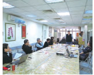
第3次常務理事會議