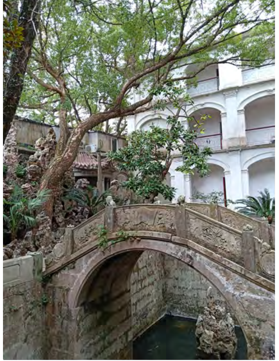
◆文昌閣花園裡的石拱橋。

石拱橋悠悠然跨立於小池塘之上，南北跨臥，與永壽橋、海會橋相比，文昌閣的石拱橋可能顯得小巧玲瓏了，但望柱、欄板、抱鼓石等一應俱全，整體保存較為完善。石拱橋的拱券由塊石幹砌而成，規