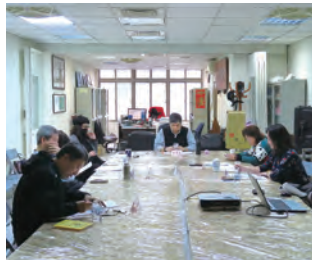
第4次康樂服務委員會會議