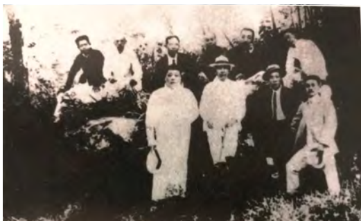
◆孫中山先生一行共七人，照片中共有十人，其中還有陪同遊山的前寺主持、高僧了餘（1864—1924）等三人。

余因察看象山、舟山軍港，順道趣遊普陀山。同行者為胡君漢民、鄧君孟碩、周君佩箴、朱君卓文，及浙江民政廳秘書陳君去病(1)，所乘「建康」艦艦長則任君光宇也。抵普陀山，驕陽已斜，相率登岸，逢北京法源寺沙門道