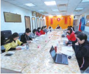
第16次理監事聯席會議