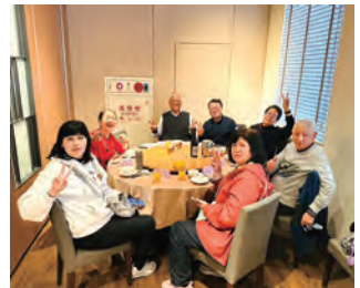
陳理事長邀宴本會理監事及貴賓喝春酒之三