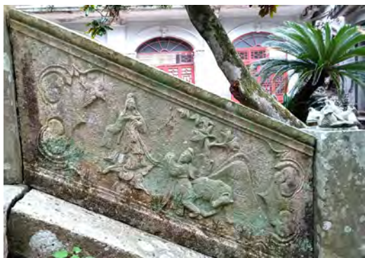
◆觀音菩薩和牧童的圖案。