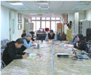
第9次青年教育工作委員會議