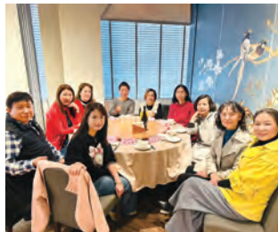
陳理事長邀宴本會理監事及貴賓喝春酒之二