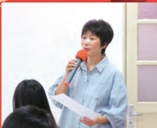
本會第19屆第1次康樂服務委員會議