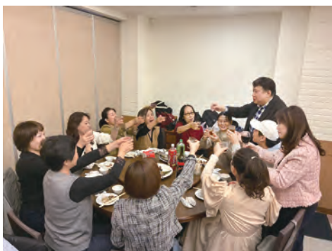
屠理事長夫婦向理監事敬酒1