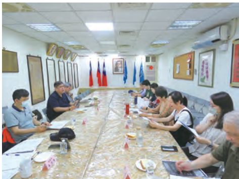
第2次青年教育工作委員會議