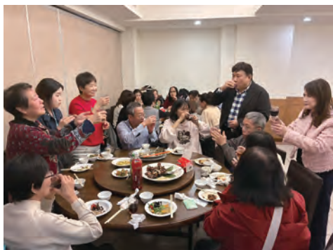
屠理事長夫婦向理監事及眷屬敬酒2