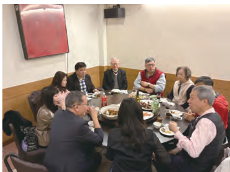
屠理事長夫婦招待貴賓