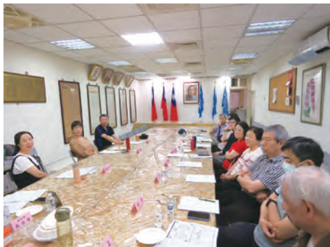
第3次康樂服務委員會議